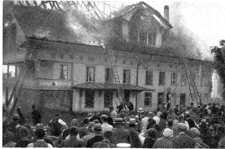
Der Brand vom Gasthof zum Bären in Biglen.

Der kantonale Trachtenzug in Lützelflüh am 1. September war außerordentlich gut besucht. Es wurden folgende 10 neue Gruppen in die kantonale Vereinigung aufgenommen: Lengnau, Nidau, Herzogenbuchsee, Neueneegg, Mühlethurnen und Umgebung, Burgdorf, Frutigen, Adelhoden, Twann und Worb. Damit ist die Zahl der Mitglieder auf 1121 gestiegen. Nachmittags fand dann der prächtige Feltzug, angeführt von Dragonern in alter Uniform, statt. Der Festplatz füllte sich mit