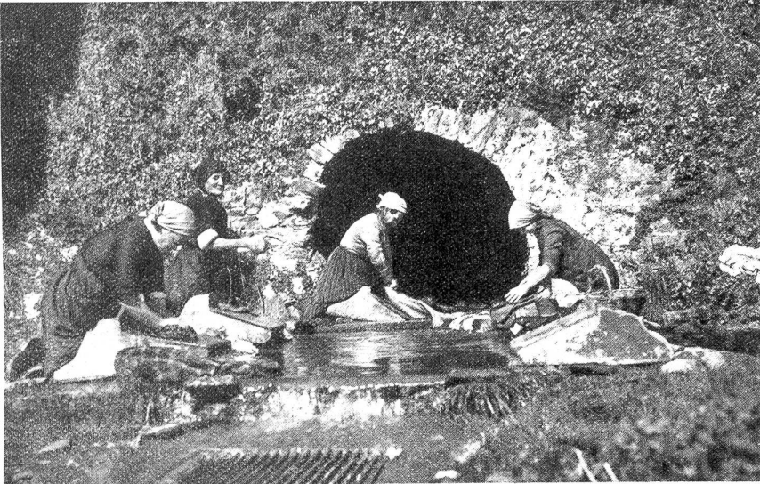
Tessiner Frauen waschen an der warmen Quelle in Ascona.