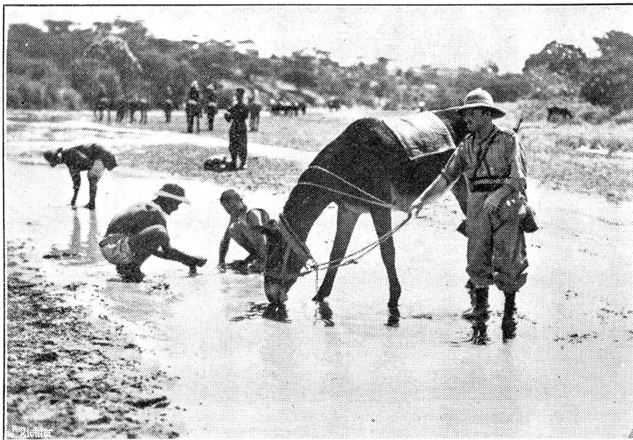
Vom Kriegsschauplatz in Abessinien. Menschen und Tiere erfrischen sich jedesmal, wenn das Glück sie an einen Fluss führt.

Neben einem Flügel vor Dschischiga mit Gesicht nach Süden steht irgendwo ein anderer mit Gesicht nach Osten, und man weiß nicht einmal, ob der verschanzte Posten bei Gorrahei in dieser Front oder noch östlicher kämpft. Bisher hat er sich gegen die Bomben gehalten und den italienischen Erkundungsvorstößen verwehrt, weiter nach Westen zu dringen, um den gegnerischen Aufmarsch zu studieren.