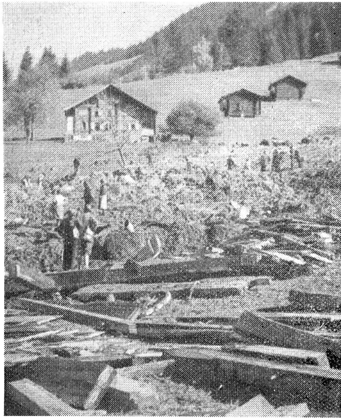
Ein Bauernhaus vom Unwetter zertrümmert.

Wie wir in der letzten Nummer berichteten, riss ein durch das Unwetter verursachter Erdrutsch unweit Saanen (bei Rougemont) ein Bauernhaus mit, wobei drei Menschen ums Leben kamen. Unser Bild zeigt die Trümmerstätte.