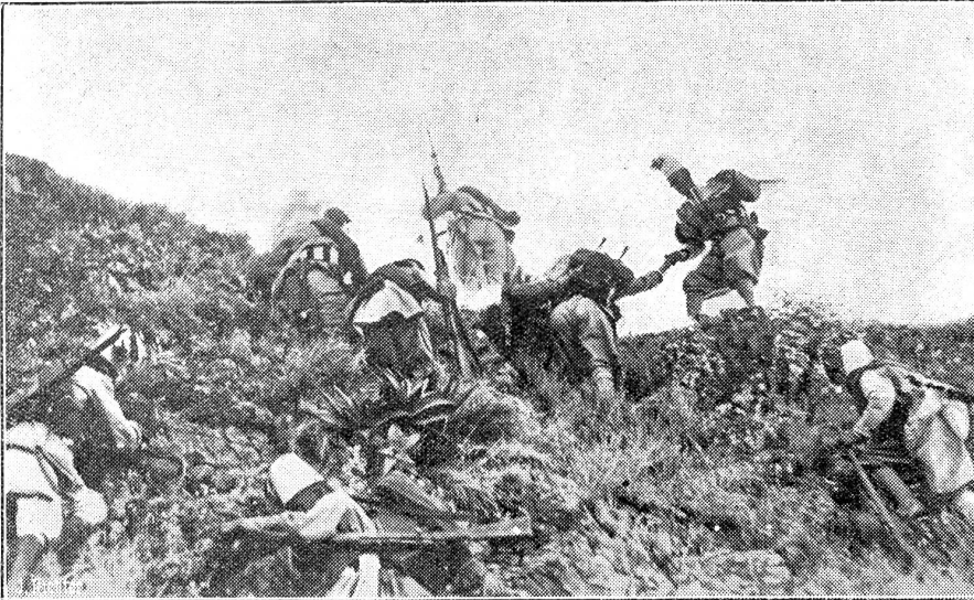
Zum italienisch-abessinischen Krieg.

Im Kampf mit den Abessiniern erweisen sich die Askari-Truppen der Italiener als wertvolle Streitkräfte. Unser Bild zeigt die gut ausgebildete Askari-Infanterie beim Vorgehen in hügeligem Gelände.