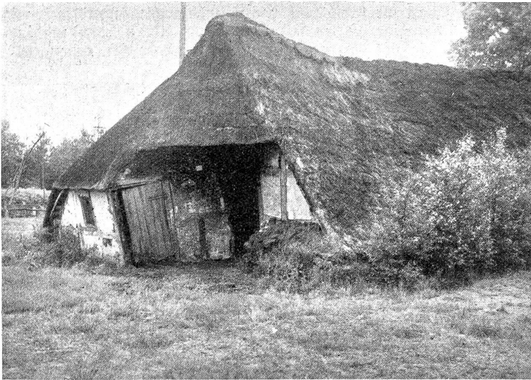
Moorkate im Teufelsmoor bei Worpsswede.

1901 trat er von seinen Geschäften zurück, verkaufte seine sämtlichen Gründungen dem berühmten und vielleicht auch berühmtesten Morgan. Bis zu seinem Tode bemühte sich Andrew Carnegie nun mit der Verteilung seines Reichtums. Für seine ehemaligen Arbeiter stiftete er 4 Millionen, eine weitere Million — immer Golddollars — für die Gründung von Arbeiterbibliotheken und Lesesälen. Den New Yorker Volksbibliotheken schenkte er 5¼ Millionen, gründete am 28. Januar 1902 das Carnegie-Institut in Washington mit zunächst 10 Millionen, die er später auf 25 erhöhte. Dieses Institut sollte in großzügiger Organisation der wissenschaftlichen Forschung dienen, der Entdeckung, der praktischen Verwertung aller Kenntnisse für den Fortschritt der Menschheit, der Förderung von Kunst und Literatur. Endlich stiftete er den sogenannten Heldenfonds zur Belohnung von Helden, die Menschenleben gerettet haben, zur Unterstützung von Familien, deren Väter oder Söhne bei der Lebensrettung verunglückten. Im Laufe der Zeit wurde dieser Fonds auch England, Frankreich, Deutschland, Italien, Belgien, Holland, Norwegen, Schweden, der Schweiz und Dänemark dienstbar gemacht: „Die Helden der barbarischen Vergangenheit verwundeten oder töteten ihre Mitmenschen; die Helden unseres zivilisierten Zeitalters setzen es sich zum Ziel, ihren Brüdern zu dienen und sie zu retten. Das ist der Unterschied zwischen physischem und moralischem Mut, zwischen Barbarei und Kultur“.