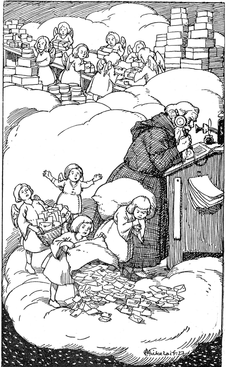
Die ersten Weihnachtsbestellungen. Knecht Ruprecht am Fernsprecher. Zeichnung von C. Mikelaith.

Von drauß, vom Walde komm ich her; Ich muß euch sagen, es weihnachtet sehr! Allüberall auf den Tannenspitzen Sah ich goldene Lichtlein sitzen, Und droben aus dem Himmelstor Sah mit großen Augen das Christkind hervor. Und wie ich so stolcht durch den finstern Tann, Da rief's mich mit heller Stimme an: „Knecht Ruprecht“, rief es, „alter Gesell, Hebe die Beine und spute dich schnell! Die Kerzen fangen zu brennen an, Das Himmelstor ist aufgetan, Alt und Junge sollen nun Von der Jagd des Lebens einmal ruhn, Und morgen flieg ich hinab zur Erden; Denn es soll wieder Weihnachten werden!“ Ich sprach: „O lieber Herr Christ, Meine Reise fast zu Ende ist; Ich soll nur noch in diese Stadt, Wo's eitel gute Kinder hat.“ — „Hast denn das Säcklein auch bei dir?“ Ich sprach: „Das Säcklein, das ist hier: Denn Äpfel, Nüss' und Mandelkern Fressen fromme Kinder gern.“ — „Hast denn die Rute auch bei dir?“ Ich sprach: „Die Rute, die ist hier; Doch für die Kinder nur, die schlechten, Die trifft sie auf den Teil, den rechten.“ Christkindlein sprach: „So ist es recht; So geh mit Gott, mein treuer Knecht!“ Von drauß, vom Walde komm ich her; Ich muß euch sagen, es weihnachtet sehr! Nun sprecht, wie ich's herinnen find! Sind's gute Kind, sind's böse Kind?