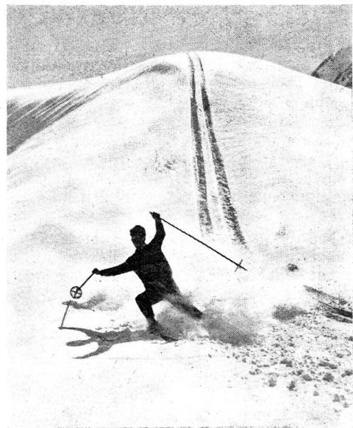
Bei Adelboden, rassige Abfahrt.

PS. Schick mir ein Paar neue Skihosen, möglichst mit Lederbeleg. Meine sind schon zweimal gestickt und das sieht gar nicht chic aus.