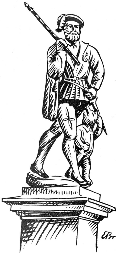
Abb. 1: Läuferbrunnen (Läuferplatz).

Dem Durchschnittsberner sind die alten Brunnen in seiner Vaterstadt etwas so Selbstverständliches, daß er ihnen selten Beachtung schenkt. Sie sind einfach da, das genügt. Wer hätte überhaupt heute noch Zeit, sich mit solch alten Gebilden zu befassen. Das sind Sachen für die Fremden.