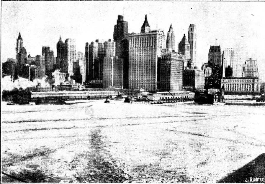
New Yorks Hafen vereist. Eine Ansicht von Bord der „Berengaria“ bei ihrer Einfahrt aufgenommen.

chinesischen Roten marschieren müßte, Japanhaß in China hin oder her. Ueber diese heikle Differenz wird Litwinow vor dem britischen König kaum gesprochen haben. Sie bildet aber zweifellos den Grund des letzten britischen Zögerns, Rußland mit dem vollen Einsatz seiner finanziellen und industriellen Kraft zu unterstützen.