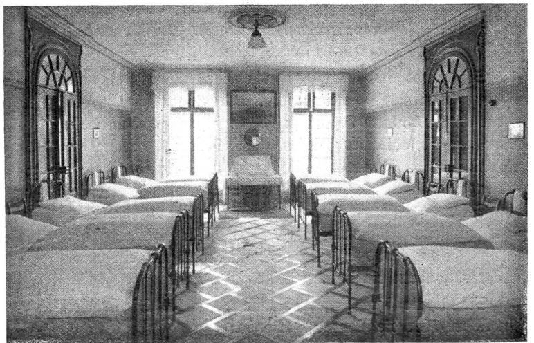
Herberge zur Heimat, Bern. Ein Schlaflaal.