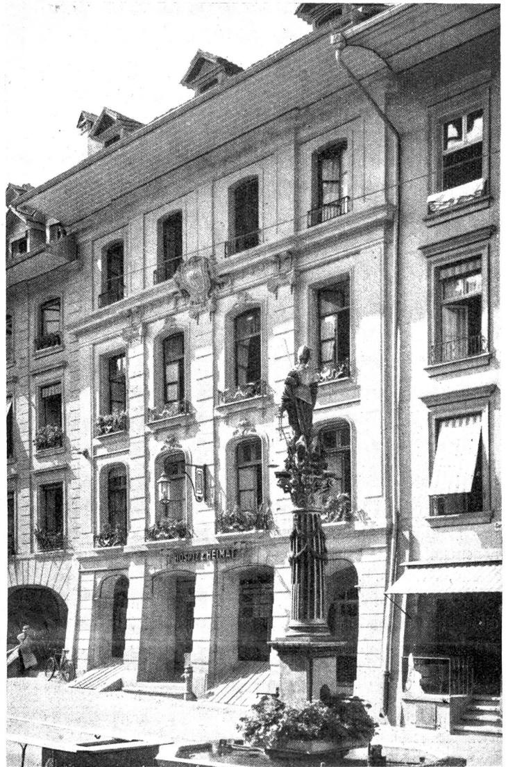
Die Herberge zur Heimat an der Gerechtigkeitsgasse, Bern. Zum Aufsatz S. 144.

Nun kam auch Holzer. Er hatte seinen Kittel ange-