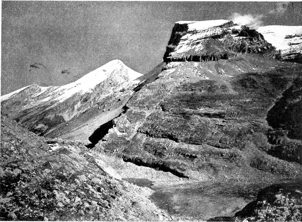
Schwarzenbach am Weg zum Gemmipass mit Altels und Rinderhorn.

Liebe. Es ahnt und weiß zuviel und möchte seiner Mutter noch eine große, große Freude machen mit einer eigenen Arbeit, wenn möglich an der Weihnacht. Der Lehrer wird das Mädchen zu beschwichtigen suchen und mit ihm vielleicht sogar auch ganz ruhig über seine fernere Zukunft sprechen, wenn es sich herausstellen sollte, daß sich Grütli auch schon in dieser Hinsicht Sorgen gemacht hat. Einen Augenblick steht er noch sinnend da. Nun versteht er vieles in der Seele dieses Mädchens. Eine weite Landschaft deckt sich vor ihm auf, darin er einen Weg aus düsterem Gebiet in hellere Bezirke sucht. Eine verantwortungsvolle Pflicht steht ihm bevor, eine Arbeit, die nicht in raschen, äußerlich meßbaren Resultaten festzustellen ist. Er wird seine Aufgabe nach bestem Wissen und Gewissen lösen; denn auch er ist überzeugt: Für das Kind, die Zukunft, hat man sich mit ganzer Kraft und vorbehaltlos einzusetzen.