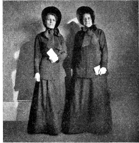
Vor vierzig Jahren trugen die Heilsarmeeoffizierinnen Uniformen, die etwa dieser in der Jubiläumskundgebung in Bern gezeigten Nachbildung entsprach.

„Warum denn“, so fragen wir uns oft, „sind denn die Leute der Heilsarmee immer fröhlich und guten Mutes, wiewohl ihre Arbeit sie in die traurigsten Verhältnisse blicken läßt und von ihnen so manches Opfer fordert?“ Wir haben diese Fröhlichkeit auch bei den Salutisten der großen Städte getroffen, die noch viel größere Aufgaben zu erfüllen haben. Wem es vergönnt ist, Salutisten und