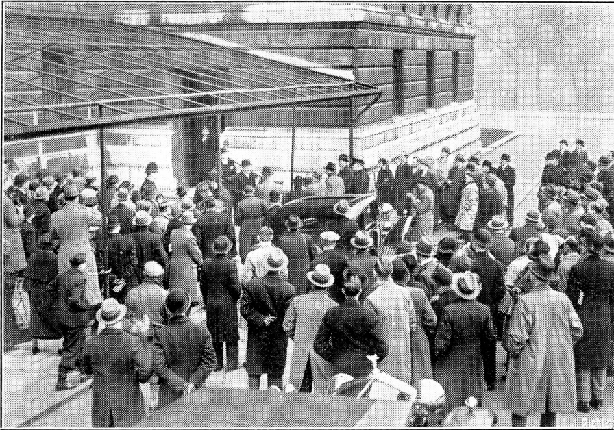
Locarno-Mächte tagen in London. Menschenmenge vor dem Foreign Office.

Eine Ansicht der Menschenmenge vor dem Foreign Office in London während der Lunchzeit; Der italienische Botschafter und Delegierte bei der Konferenz, Grandi, verlässt eben das Gebäude und wird von den Presse-photographen „gestellt“.