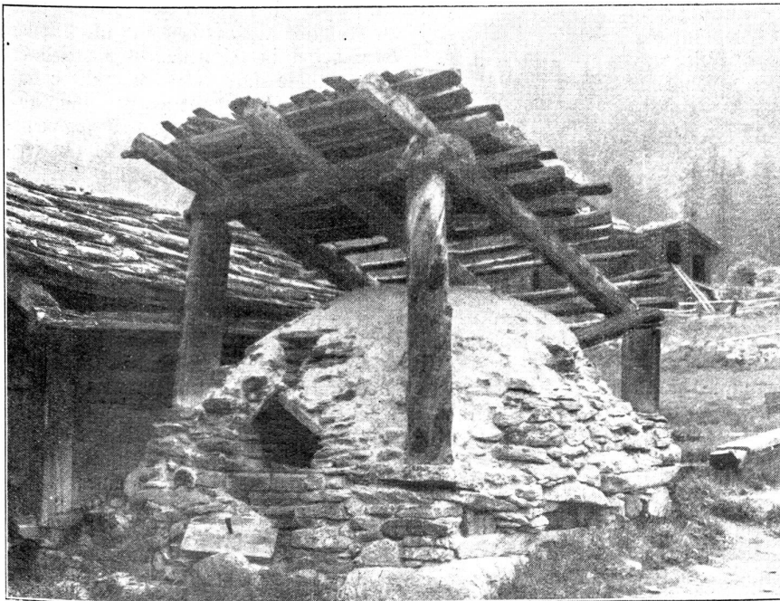
Backofen im Nikolaital.

Im Backhaus ist an der Wand eine Liste angeschlagen, auf welcher der Reihe nach alle Familien mit ihren bestimmten Back-