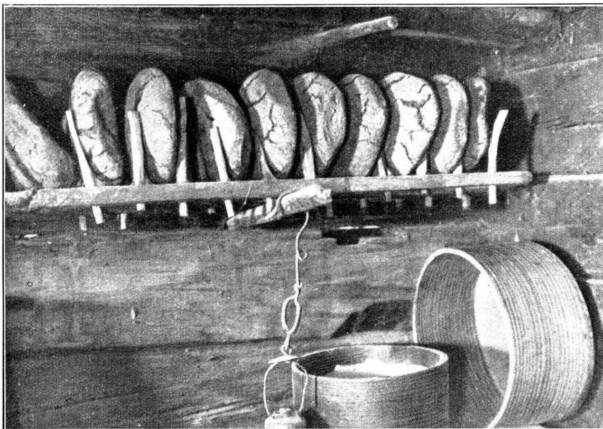
Aufbewahrung des Walliserbrotes im Speicher.