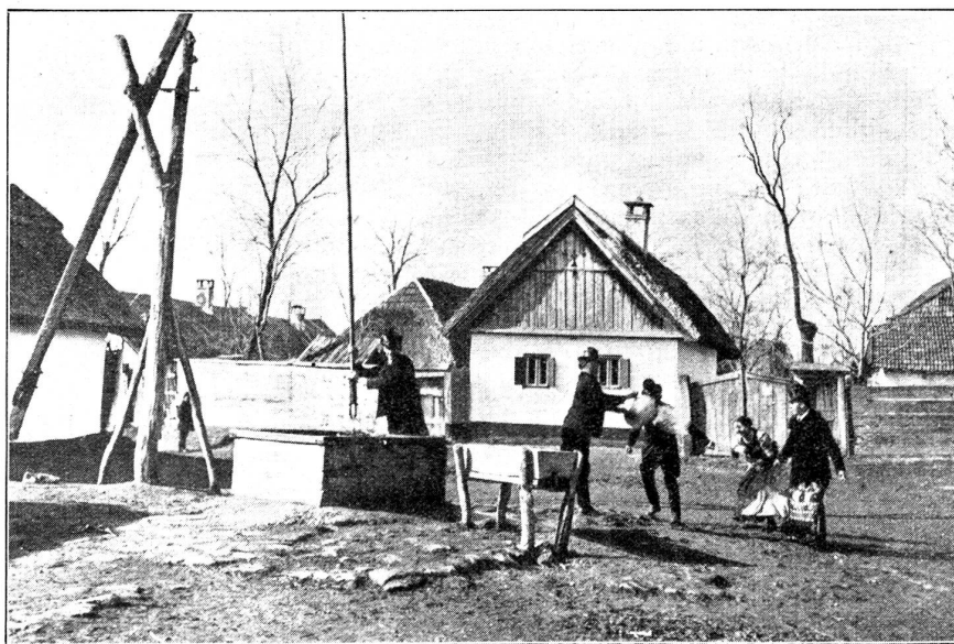
Ein alter Osterbrauch in Ungarn. Das Begießen mit Wasser.

„... und wer nicht eine Knospe der Osterpalme verschluckt hat, wird keine Erlösung erhalten“ — hieß es einst. Natürlich dachte man dabei an die geweihte „Palme“, beziehungsweise an ihre Stellvertreterin, die Weide, die seit