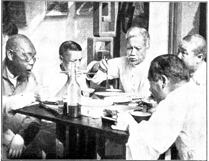
Chinesische Mahlzeit. Tisch der Männer. Die Frauen essen abgesondert. Die Abfälle wirft man unter den Tisch, so daß am Ende der Mahlzeit der Boden mit Speiseresten und Knöchelchen besät ist.