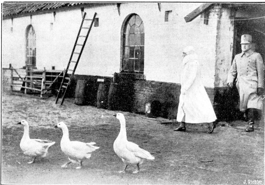
Königin Wilhelmine auf dem Bauernhof.

Königin Wilhelmine von Holland wohnte in Den Haag den Artillerie-Manövern bei. Nach den Übungen begab sie sich zu einem Imbiß auf einem echt holländischen Bauernhof. Unser Bild zeigt die Königin, gefolgt von einem General, beim Betreten des Bauernhofes.