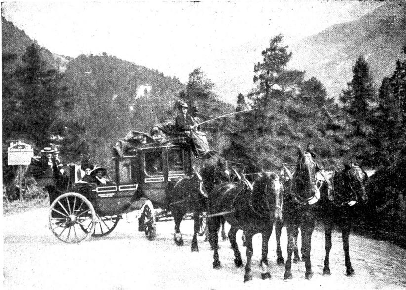
Eine 5spännige Alpenpost (8plätziger Kupee-Landauer.)

irgendwelchen anderen Regeln sein sollte, sondern ein erbitterter Faustkampf, fortgeführt, bis der eine oder andere niedergeschlagen war. Aus diesem Grunde war auch ein Umpire nicht vomnöten.