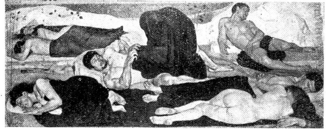
F. Hodler: Die Nacht.

gefundenen und nicht minder genial berechneten Aufbau plastischen Gruppen gleichend, die deshalb von vielen nicht eigentlich als Malereien oder Farbwerke aufgefaßt werden wollen. Tatsächlich ist mit Hinblick auf Raumverteilung und