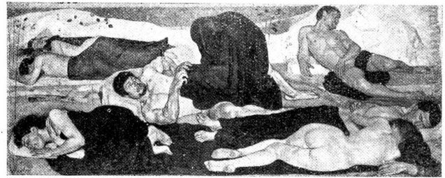
F. Hodler: Die Nacht.

gefundenen und nicht minder genial berechneten Aufbau plastischen Gruppen gleichend, die deshalb von vielen nicht eigentlich als Malereien oder Farbwerke aufgefaßt werden wollen. Tatsächlich ist mit Hinblick auf Raumverteilung und