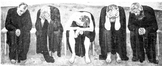
F. Hodler: Die Enttäuschten.

So entstehen die symbolträchtigen Bilder, jeweils nur einer einzigen überragenden Idee geweiht, in ihrem genial