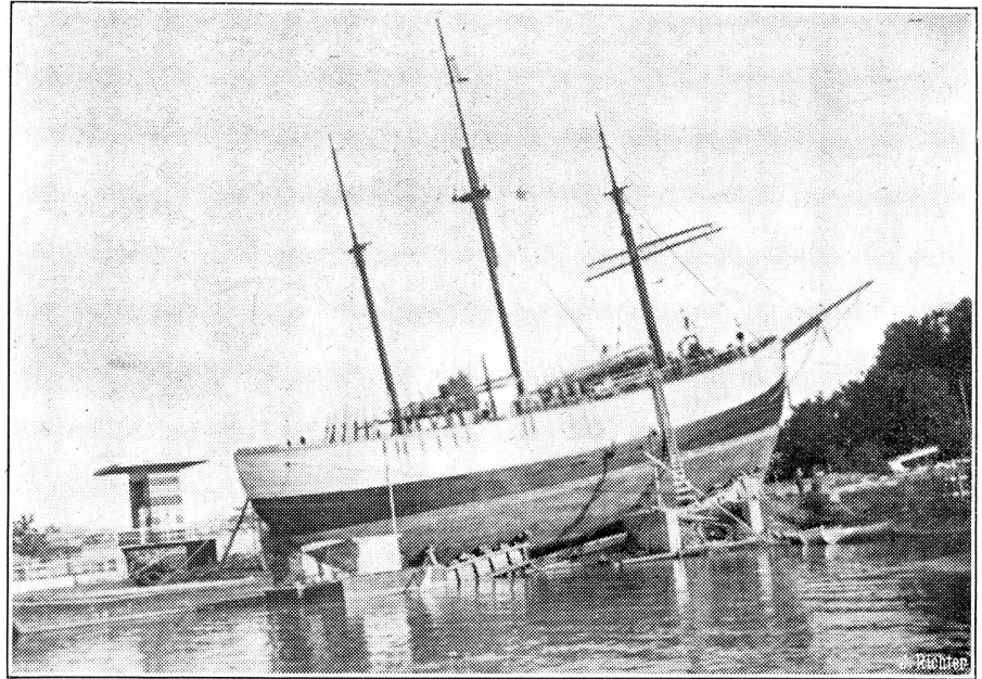
Die „Fram“ wird an Land gebracht.

Für das berühmte norwegische Entdeckerschiff „Fram“ wurde an der Küste in der Nähe Oslos ein Haus gebaut, um dieses nationale Heiligtum zu erhalten. „Fram“ wurde von Fritjof Nansen und Roald Amundsen für ihre Nord- und Südpolexpeditionen benützt. Das kräftige 900 Tonnen starke Schiff wurde jetzt mit Hilfe hydraulischer Maschinen an Land gehoben. Um das Schiff herum wurde ein Haus gebaut. War „Fram“ in der Vergangenheit das abenteuerlichste aller Schiffe, ist sie jetzt das bestgeborgene Schiff der Welt.