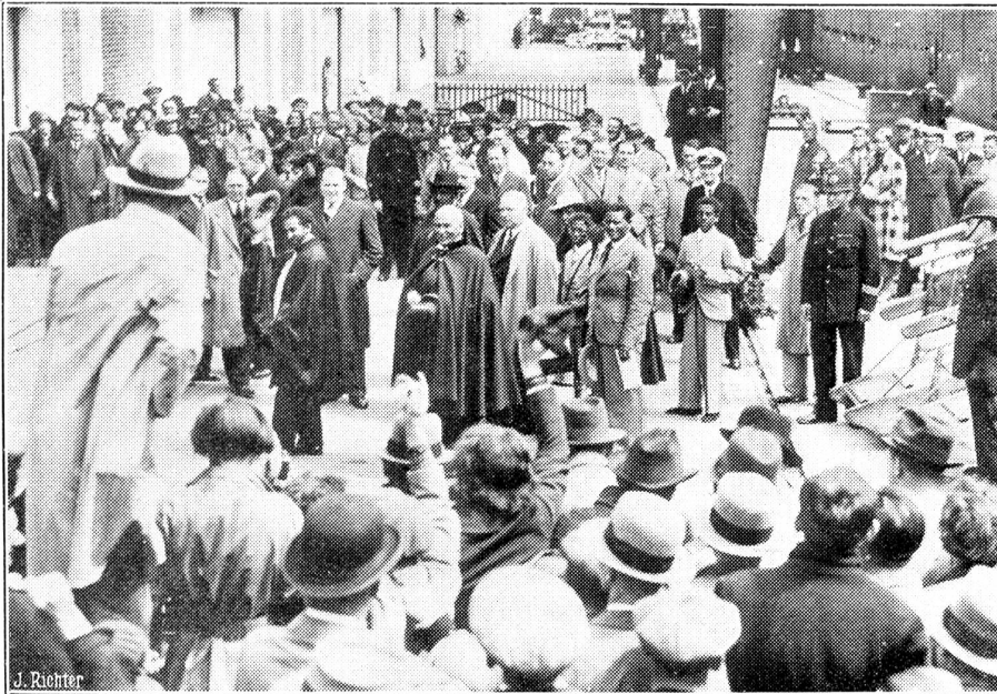
Der Negus in England.