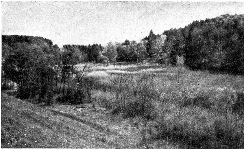
In der Au. Partie aus der Elfenau.

men und Darnachachtung noch ein Marterl der Bayrischen Bergwacht hier anführen, das da lautet: