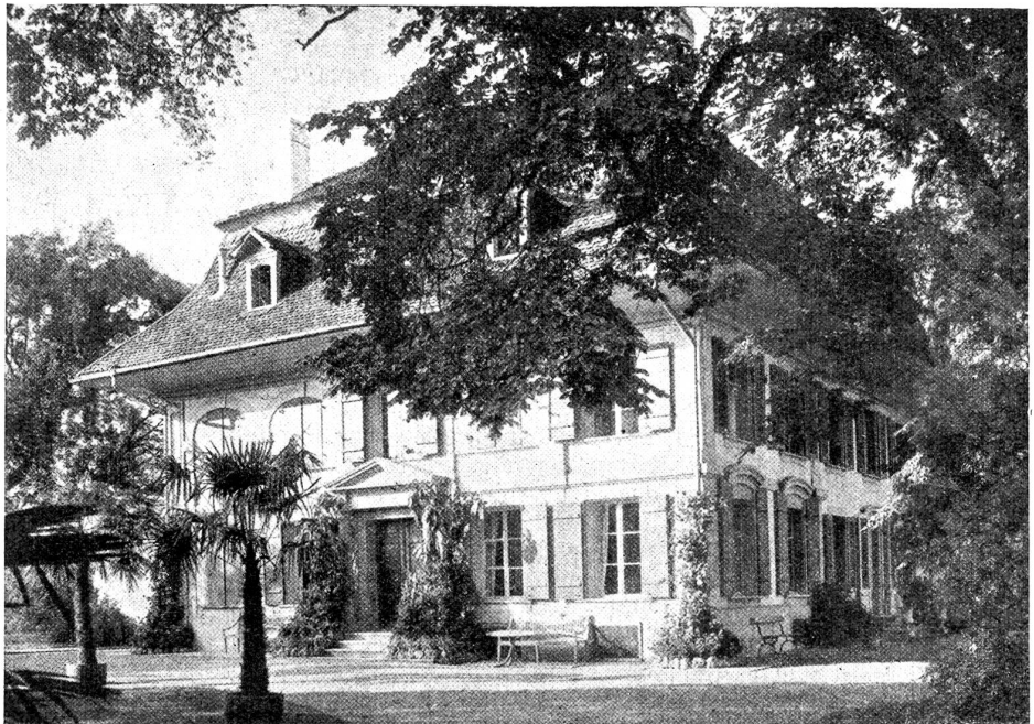
Die „Elfenau“ Ehemaliges Wohnhaus der russischen Grossfürstin Feodorowna.

„Vater, ich möchte lieber nicht mitkommen. Es ist doch so langweilig, in dieser eintönigen Gegend herum zu hum-