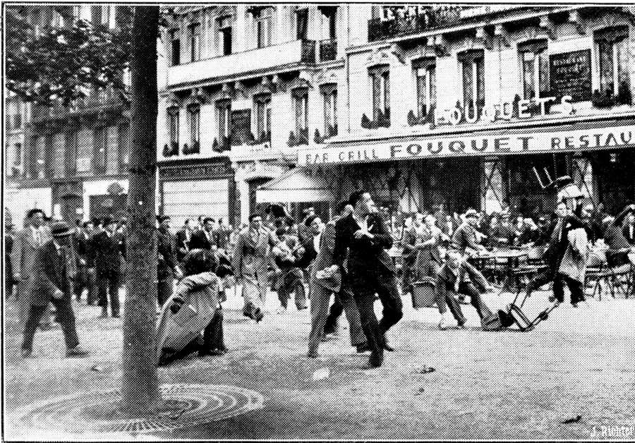
Unruhen in Paris.

Auf den Champs Elysée kam es zu schweren Zusammenstößen zwischen einer vieltausendköpfigen Zuschauermenge und der Polizei. Nach der Neuentfaltung der Flamme am Grabe des Unbekannten Soldaten durch ehemalige Frontkämpfer, bildete sich ein grosser Zug von zahlreichen rechtsgerichteten Personen — offenbar Angehörige der aufgelösten Feuerkreuzler — der durch die Champs Elysée marschierte. Biergläser, Kaffeetassen, Stühle, sogar ganze Kaffeehauseinrichtungen dienten bei den Unruhen als Wurfgeschosse.