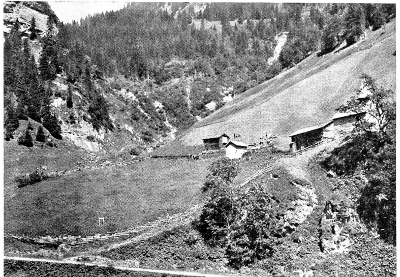
St. Martin in Calfeisen. 1350 m. St. Martinsfest, Sonntag nach Jacobi.

Die fünf Stunden lange Wanderung durch die Tamina-schlucht und das waldige Taminatal über Bättis nach Sanct