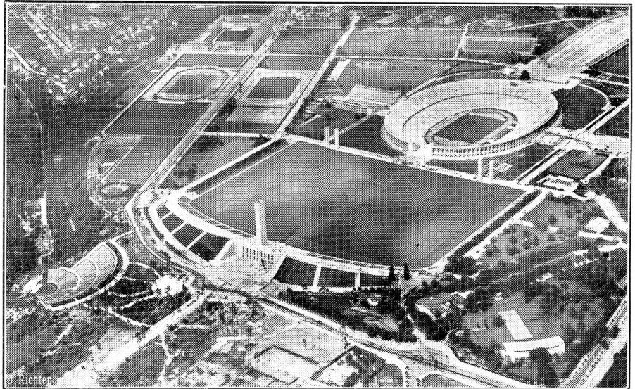
Luftaufnahme des Reichssportfeldes in Berlin.

Nun ist die Aktion gekommen, und man weiß nicht,