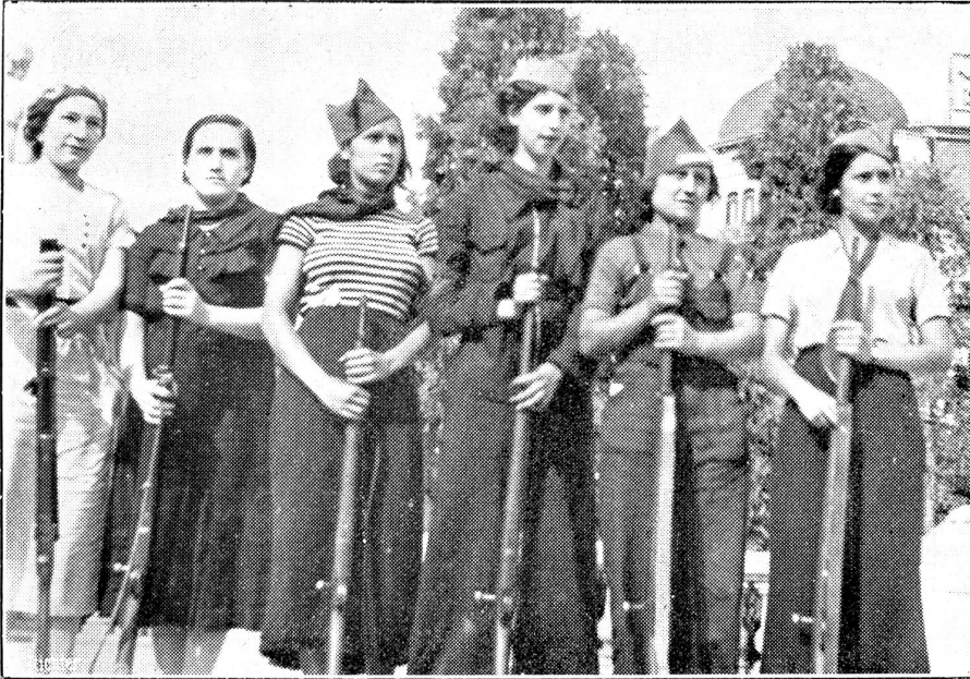
Zum Bürgerkrieg in Spanien. Eine Gruppe von Arbeitermädchen als Mitglieder der Arbeitermiliz.

Die Russen haben momentan der deutschen Propaganda wenig entgegenzusetzen. Sie wissen nur, daß Berlin alles tut, um die spanische Affäre auszunützen — gegen die Stellung Rußlands. Also ist es logisch, Spanien zu stützen. Die russischen Gewerkschaften haben der Volksfrontregierung in Madrid viele Millionen überwiesen, und der Sender in Moskau verbreitet jeden Abend Nachrichten über die deutschen Flugzeuge und die deutschen Waffen in Spanien. Also: Russisch-spanische Verschwörung! Geschickt richtet Berlin zu gleicher Zeit eine Protestnote gegen Moskau und gegen Madrid: Verlangt wird, daß die Sender in beiden Städten die Hebe gegen das Dritte Reich und Hitler einstellen. Geschickt: Von nun an wird man Moskau und Madrid zusammenzählen. Und vergessen wird man, zu fragen, was eigentlich die beiden Sender gegen das Dritte Reich gesprochen. Und weiter wird man darüber vergessen, daß die deutschen Sender der Ansicht sind, in Spanien regiere die Mordkommune, und daß sie die Rebellen von Anfang an mit „Nationalisten“ angesprochen.