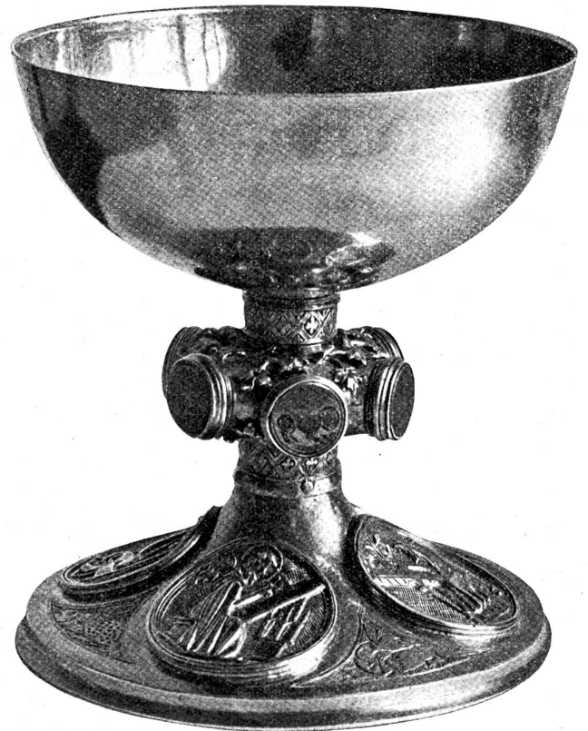
Zwinglibecher, den Zwingli verwendete, als er Geistlicher in Glarus war.

Erwähnen wir noch einen Metallleuchter flämischer Arbeit aus der zweiten Hälfte des 15. Jahrhunderts, der gleichfalls der Burgunderbeute zugeschrieben wird.