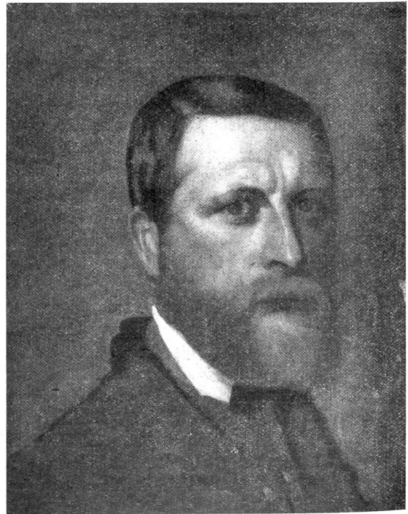
Barthélemy Menn: Selbstbildnis.

Wohl sind den meisten, die zu ständigen Besuchern der bernischen Kunstausstellungen geworden sind, von jeher die