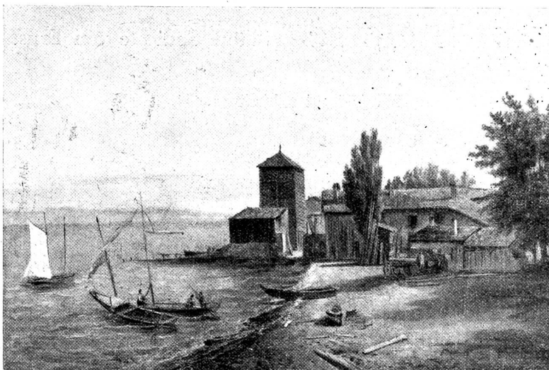
François Diday: Am Genfersee.

Die Namen Agasse, Töpffer, Calame und Menn sind es denn auch, denen der Besucher zuerst Beachtung schenkt. Er gewahrt französische und holländische Einflüsse in ihrer sorgfältig und verantwortungsbewußt dargebrachten Kunst. Was ihm heute vielleicht zu zierlich, zu gestell, sogar zu schematisch angeordnet und idyllisch aufgebaut erscheinen mag, war edle und sehr gewissenhafte Absicht, war durchaus künstlerisches Schaffen und notwendigerweise mit dem Stempel jener Zeit behaftet. Die Pferde des sicher malenden und in seinem Spezialfache gründlich ausgebildeten Agasse be-