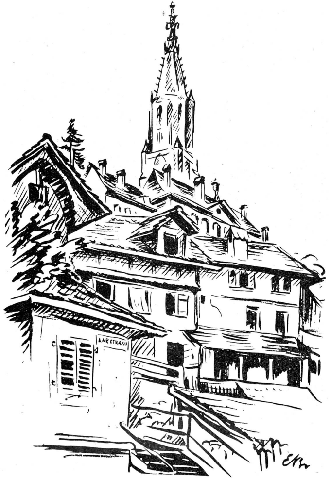
Aufgang zur Fricktreppe zum Münsterplatz.

Nun aber zurück zur Stadtbesichtigung. Ueberqueren wir den Bärenplatz in südlicher Richtung, so gelangen wir zum Bundesplatz und den ausgedehnten Verwaltungen der Eidgenossenschaft, dem Bundeshaus und Parlament. Der Mittelbau mit dem Nationalratssaal und den andern Sitzungszimmern unserer Regierung, stellt einen recht repräsentablen Bau, aber ohne einheitlichen Stil, dar. Die Besucher werden unentgeltlich durch die Räumlichkeiten geführt und erhalten so Gelegenheit, neben andern zwei gewaltige Wandbilder zu sehen: das eine, von Giron, den Vierwaldstättersee darstellend, das andere, von Welki und Balmer, „Die Landsgemeinde“. Der Besucher des Bundeshauses sollte nicht veräumen, von der Bundesterrasse aus einen Blick auf das Aaretal und die Berner Alpen zu werfen, sofern die letzteren