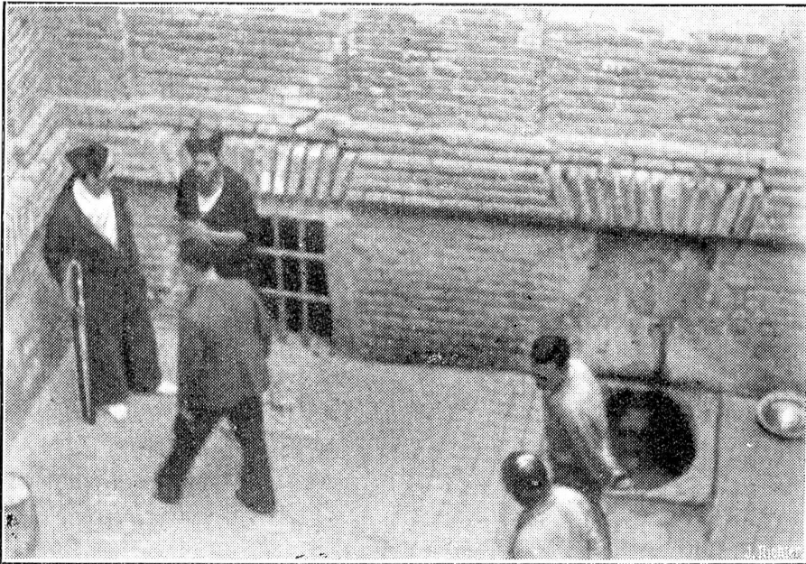
Aus dem „Hause der Toten“ in Toledo.

In Toledo werden von den Kommunisten noch zahlreiche Geiseln gefangen gehalten, die einem furchtbaren Schicksal entgegengehen, denn alltäglich wird eine Anzahl dieser Geiseln ermordet. Unser Bild zeigt einen Blick in den Gefängnishof von Toledo. Links in der Ecke Rotgardisten, im Vordergrund Gefangene. Bei der geringsten unerlaubten Bewegung heben die Soldaten das Gewehr zum tödlichen Schuss.