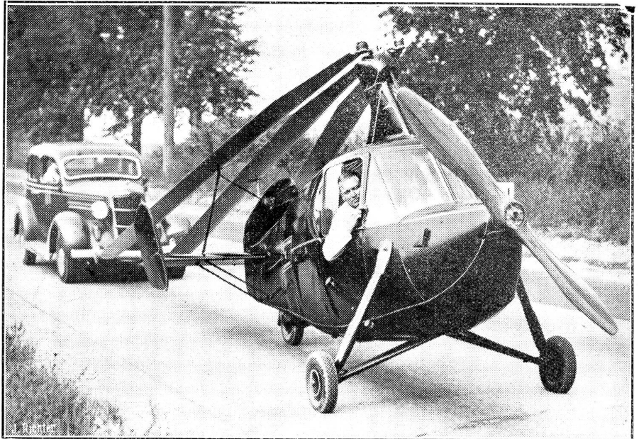
Ein ganz neuartiger Autogiro.

Es ist ein außerordentlich verdächtiges Zeichen, daß sich endlich auch Portugal bereit erklärt hat, der Kommission beizutreten, die über das Neutralitätsabkommen zu wachen hat. Man kann dieser Bereitschaft kaum eine andere Deutung geben als jene, die im Witzblatt gestanden: Das Neutralitätsabkommen tritt unwiderruflich am 1. April 1940 in Kraft. Das heißt: Wenn man Franco keine weitere Hilfe mehr zu leisten braucht; Portugal hält ihn also für hinreichend gestärkt. Die Republik aber, die von keiner Seite Unterstützung zu erwarten hat, protestiert in Genf durch den Völkerbundsvertreter und legt eine erschreckende Dokumentensammlung vor, die alles Wissenswerte über deutsche, italienische und portugiesische Lieferungen enthält.