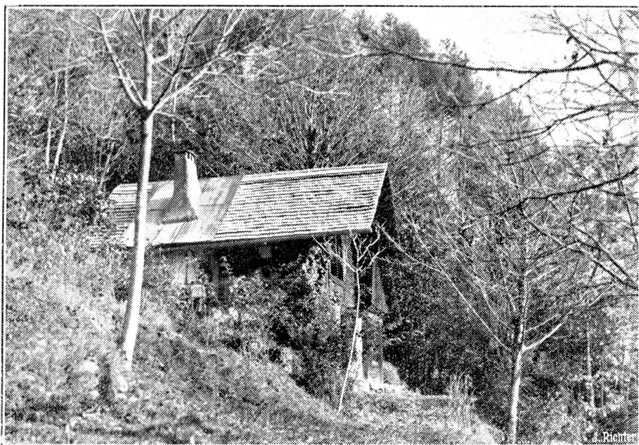
Schenkung eines Naturschutzreservates an dem Schweiz. Bund für Naturschutz.

Dem schweizerischen Naturschutzbund ist das in Herzogenacker bei Gunten am Thunersee gelegene grosse Grundstück von privater Seite geschenkt worden. Die Liegenschaft befindet sich in herrlicher Lage und eignet sich besonders als Reservat für Pflanzen und Tiere. Unser Bild zeigt einen Teilausschnitt aus dem Grundstück, das idyllische Landhaus, inmitten von Bäumen gelegen. Zum Grundstück gehört auch ein ansehnliches Waldstück.