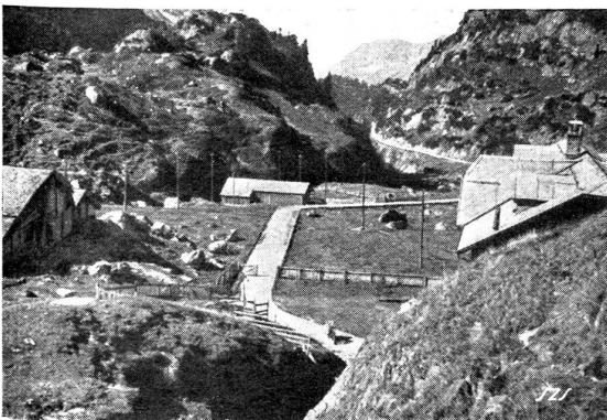
Obenher Steingletscher. Blick vom Hotel Steingletscher talauwärts gegen die „Höll“.

Es ist zweifellos so: In Europa reifen — für jeden Hellsehenden erkennbar — in unheimlicher Dynamik die politischen Entscheidungen heran, die kaum anders als mit einem neuen Weltkrieg zur Endlösung gelangen können. Da-