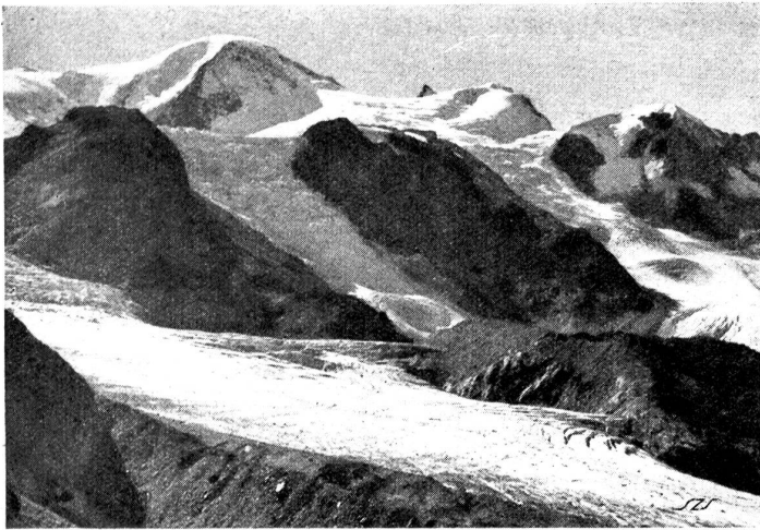
„Stuhlwang“. Blick gegen Südwesten auf den Steingletscher.

Vordergrund gestellt werden. Bei einem italienischen Angriff auf die bedrohte Südostgrenze wäre nämlich die Grimsel-Furka-Oberalprounte vom Giacomopaß her so schwer bedroht, daß sie als Aufmarschlinie für die westschweizerischen Hilfstruppen nur sehr bedingt in Frage käme. Die 20 Kilometer nördlicher gelegene Sustenstrafe hingegen würde diesem Zwecke ausgezeichnet dienen. Nicht nur würde sie um etliche Stunden schneller zum Gotthard führen, sondern sie wäre auch der ideale Zufahrtsweg zum Panixerpaß via Klausenstrafe. Diese letztere müßte natürlich den militärischen Bedürfnissen noch besser angepaßt werden. Daß eine in diesem Sinne ausgebaut Westostverbindung die strategische Lage der Schweiz an ihrer Ostmark wesentlich verbessern würde, liegt auf der Hand.