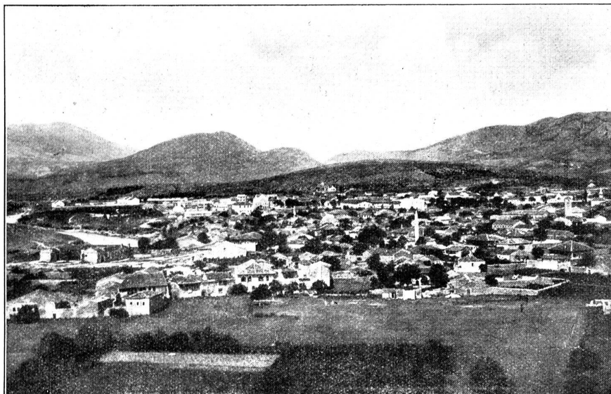
Die montenegrinische Stadt Podgorica.

die Cernogoren in ihrer ganzen Ursprünglichkeit kennen. Der Fremdenverkehr wirkte noch nicht raffeverfälschend und abschleifend. Man trägt die alte Nationaltracht, ist außerordentlich gastfrei. Nirgends reißt man sicherer als hier. Da braucht man nicht Angst zu haben, daß man bestohlen wird. Niksic selber hat 4500 Einwohner, gehört auch erst seit 1878 zu Montenegro. Die pittoreske alte türkische Festung ist noch erhalten. Die stattliche Kathedrale, für das armselige Städtchen fast zu pompös, wurde seinerzeit mit russischem Gelde gebaut, wie ja überhaupt Rußland sich des kleinen Landes vor dem großen Umsturz väterlich annahm. Eine gute Straße bringt von Niksic nach Trebinje im alten Herzegowina, einem ansehnlichen Städtchen mit Schmalspurbahn nach Ragusa. Hier hatten die Oesterreicher bis 1918 stets große Truppenbestände, um das immer kriegerische Bergvolk in Schach zu halten.