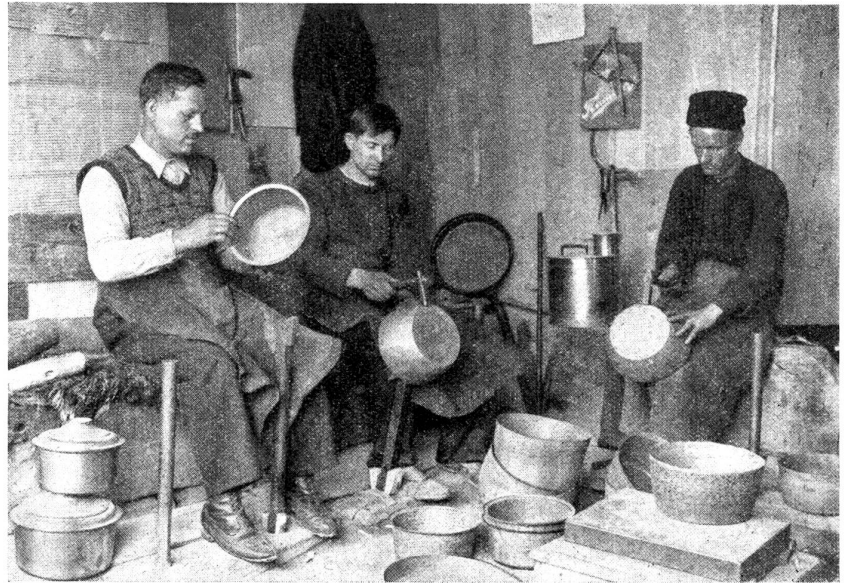
Herstellung von Kupfergeschirr durch einfaches Hämmern des Blechs.