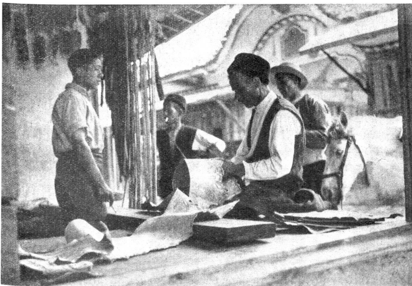
Herstellung der bäuerlichen Fußbekleidung (Opanken).

Wie aber wäre es, wenn ich mich der Wahrheitstreue beflisse? Ich spreche wahr und ehrlich zum Nächsten. Er aber mißbraucht dies und zwar vielfach. Dessen ungeachtet bleibe ich wahr und er weiß genau, woran er mit mir ist, denn das muß er ja fühlen. Er