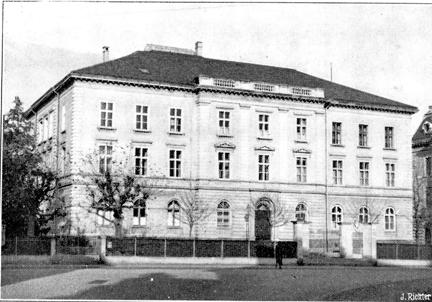
Zum Mordprozess Frankfurter in Chur.

Am 9. Dezember begann vor dem Kantonsgericht in Chur der Prozess gegen den Mörder David Frankfurter, der den Nationalsozialisten und Schweizer Landesführer der NSDAP, Gustloff, in Davos erschossen hat. Dem Prozess wird in ganz Europa grosses Interesse entgegengebracht. Die zur Verfügung stehenden 230 Sitzplätze können nur einen Teil der angemeldeten Pressevertreter aus der Schweiz und dem Auslande aufnehmen. Das Bild zeigt das Regierungsgebäude von Chur, wo der Prozess stattfindet, und zwar im Grossratsaal.