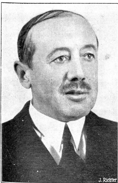
Maurice Troillet (Sitten), der neugewählte Nationalratspräsident.

Der Verwaltungsrat der Eidgenössischen Bank A. = G. hat beschlossen, einer außerordentlichen Generalversammlung der Aktionäre die Herabsetzung des Aktienkapitals von 75 auf 33 Millionen Franken zu beantragen. Die Verwendung des entfallenden Buchgewinnes von 42 Millionen Franken ist wie folgt in Aussicht genommen: a) Abschreibung des Ausfalles infolge Liquidation deutscher Engagements sowie für weitere Abschreibungen und interne Rück-