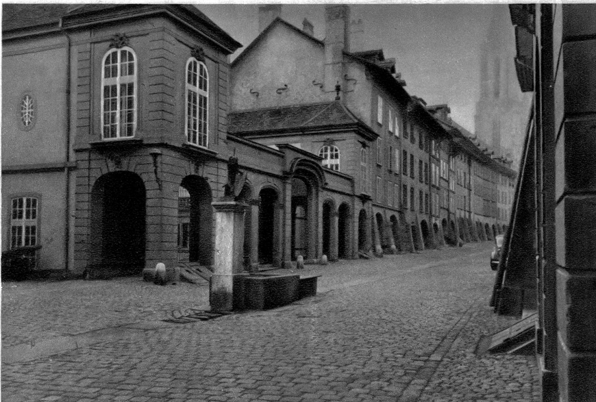
Junkerngasse, vom „Erlacherhof“ stadtaufwärts