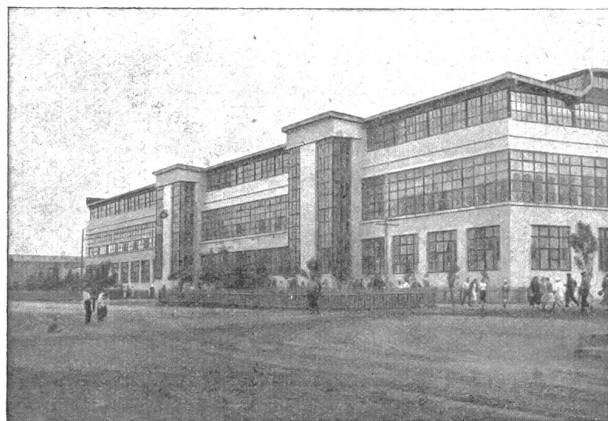
Stalingrad: Fabrikküche der Traktorenwerke, die 60,000 Essen täglich herstellt.

Darum sind wir dem Zürcher Arzt Dr. A. Boegeli dankbar, daß er in seinem eben erschienenen Buche*) sich so freimütig und ungehemmt über seine Reiseindrücke aus Sowjetrußland ausspricht und uns auch das Resultat seines Studiums der bolschewistischen Ideologie ungeschont — fast brühwarm — vorlegt, ohne sich durch Bedenken persönlicher Art Fesseln auferlegen zu lassen.