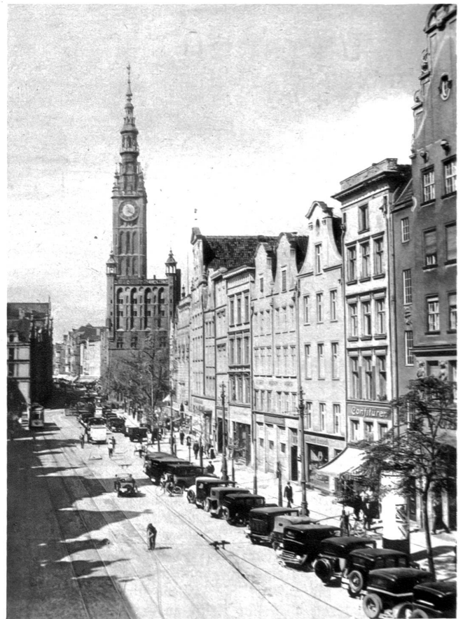
Langermarkt mit Rathaus in Danzig

portoben, die deine königliche Höhe doch nicht erreichten. — Sahst dann neues Blühen und neues Leben, warst der stolze Zeuge eines herrlichen Aufstieges — und heute — ? Es ist das alte Danzig nicht mehr, auf das du blickst. Ein neues ist an seine Stelle getreten. Fremde Trachten, fremde Bauten mischen sich in die alten, heimischen. Aber eins kann man von Danzig sagen: Wie die Zeiten auch wechselten, wie die Stürme über das trugige Haupt von St. Marien auch dahinbrausten, in ihrem Kern und Wesen blieb die alte Hansastadt immer treu, trotz dem Frieden von Versailles, trotz der Loslösung von Ostpreußen von Deutschland. Auch das ist nichts Neues. Wie überhaupt nichts Neues unter der Sonne geschieht und alles nur ewige Wiederholung und auch die Geschichte der Völker nichts ist als fließendes Gleichnis. Das ist das ausgleichende Gesetz allen Geschehens und Leidens.