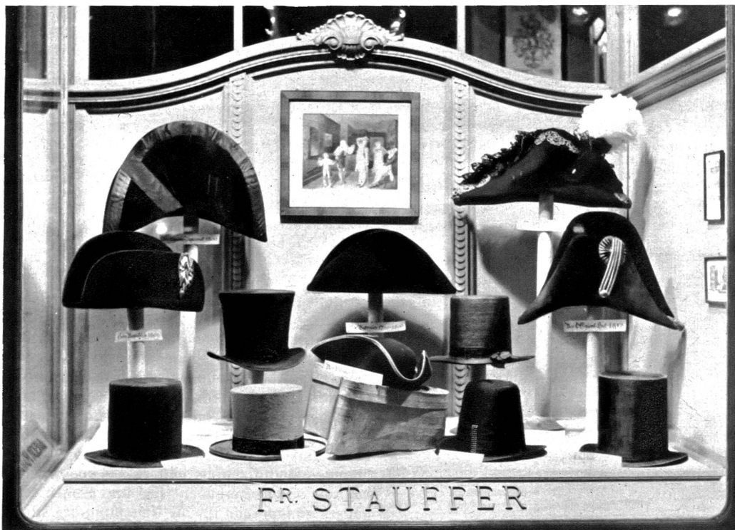
Hüte, wie man sie in Bern vor 150 Jahren trug