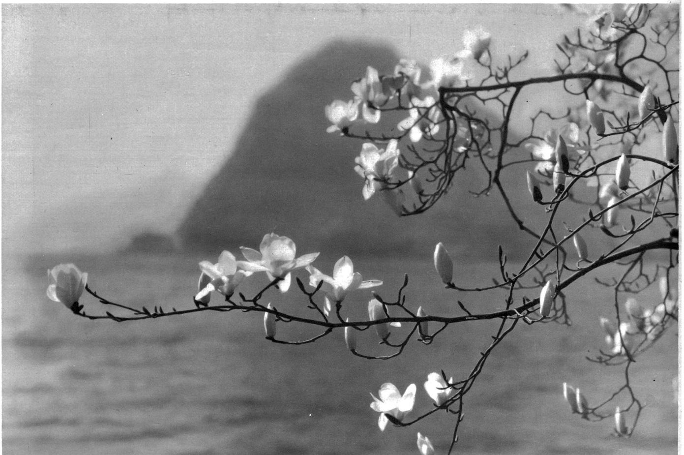
Magnolienpracht in Lugano