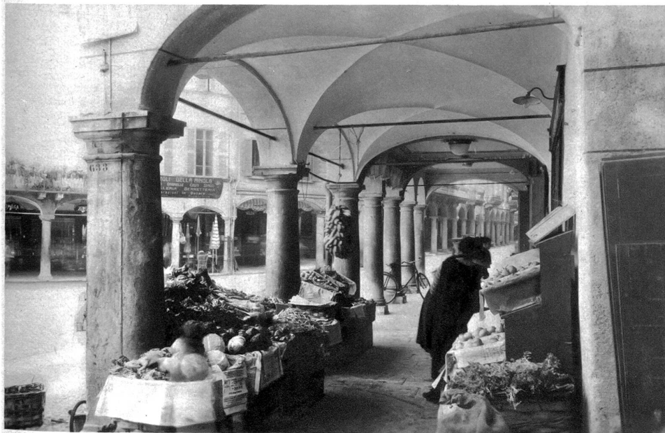
Lugano. Via Nassa

Lefer, sage ich, Mensch — überspringe einen Zug, zwei Züge, zwei Tage, zwei Wochen oder mehr in Lugano. Laß es auch regnen dabei. Geh hinauf zum San Salvatore, zum Monte Brè, hilf mit, die Heiligen zu feiern, sei es den Heiligen Josef in Sorengo ob dem idyllischen Muzzanersee, oder San Bernardo oder Gottardo bei irgend einem der vielen Kapellchen