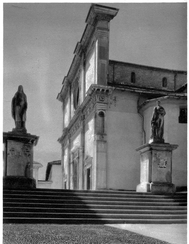
Die Kirche von San Lorenzo, der Dom von Lugano