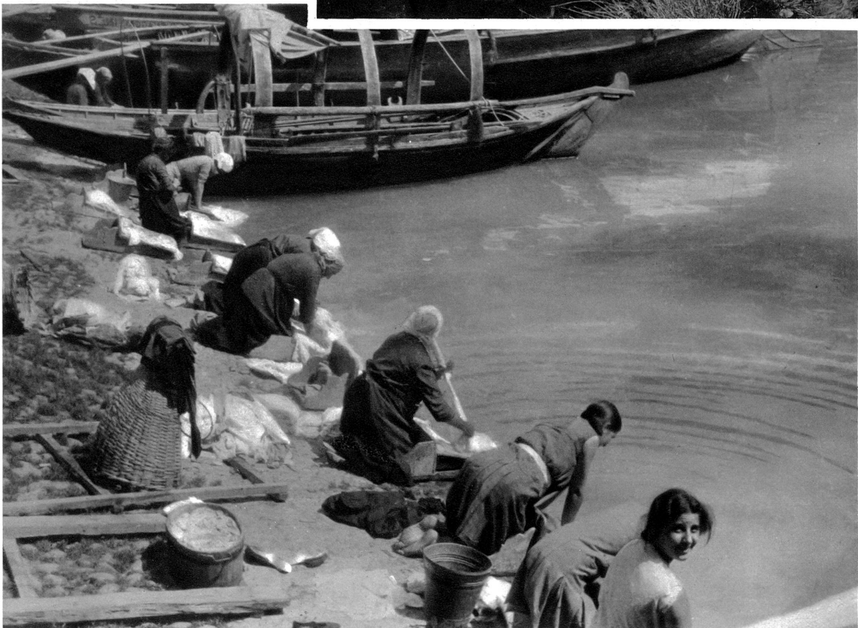
Wäscherinnen an den Ufern des Luganersees