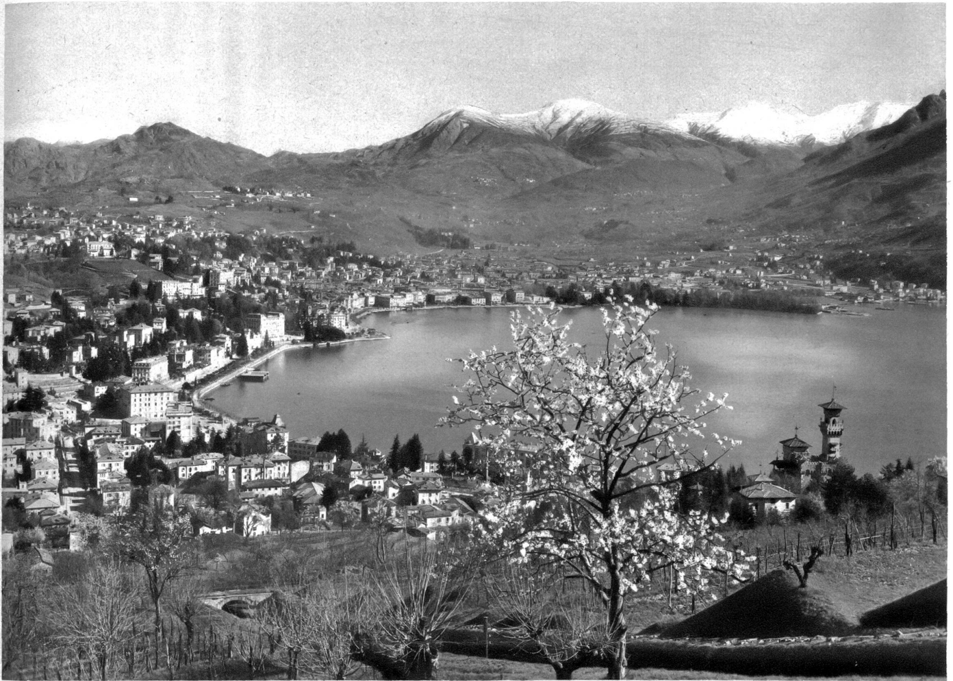
General-Ansicht von Lugano