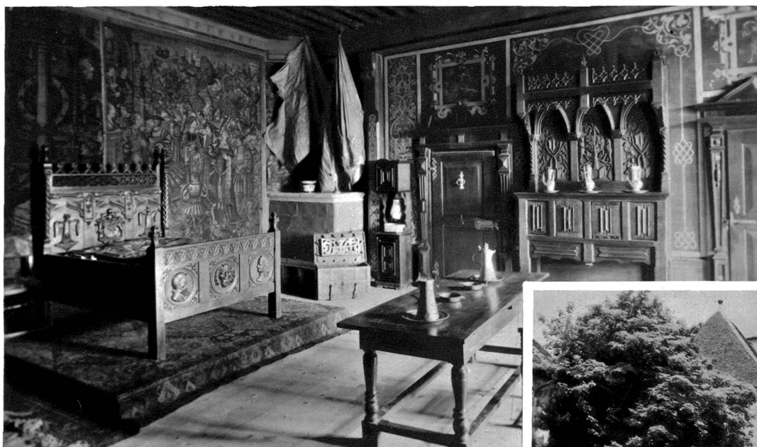
Schloss Greyerz Schlafgemach der Grafen

Es ist merkwürdig, mit wieviel sicherem Geschmack diese materische Kleinstadt angelegt worden ist, die in ihrem Aufbau und ihrer Silhouette so einwandfrei vor uns steht. Dieser künstlerische Instinkt muß auch den breiten Massen, dem gesamten Volke eigen gewesen sein, denn löbliche Baupolizeivorschriften nach unsern heutigen Mustern gab es sicherlich damals nicht. Hier fügt sich eines in das andere, dieses tritt hervor, jenes wird gemildert, und es entsteht so ein köstliches Ganzes, das ein Ueberbleibsel alter, wirklich allgemeiner Volkskunst uns mehr lehrt und zeigt, als das beste Museum in der Lage ist, es zu tun. Aber sicherlich hat man sich damals auch Zeit genommen, oft und gern beim Dämmerstoppfen mit dem Baumeister, den Nachbarn und vielleicht auch mit den Greyerzer-Grafen alle Einzelheiten der Plätze zu besprechen, und manch Schöpplein Wein wird notwendig gewesen sein, bis der Plan geboren war und die Ausführung beginnen konnte. Aber dieses gemüthvolle Zeithaben, das uns hier im Greyerzerländchen überall entgegentritt, bildet ja für uns moderne Menschen den Hauptreiz dieser alten Städtchen.