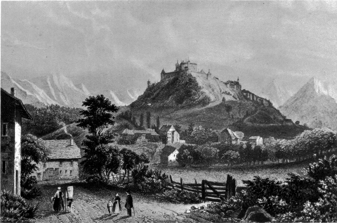
Greizer. Nach einem alten Stich von Merian