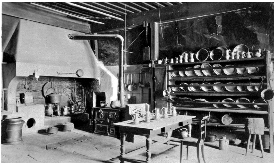
Schloss Greyerz Die Küche