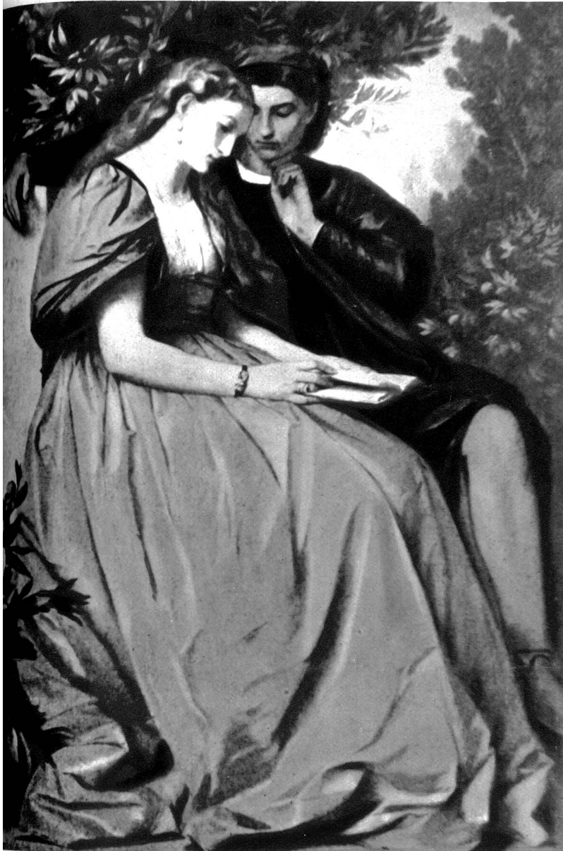
Francesca da Rimini und Paolo Malatesta, das durch Dantes „Göttliche Komödie“ berühmt gewordene Liebespaar (Gemälde von A. Feuerbach)