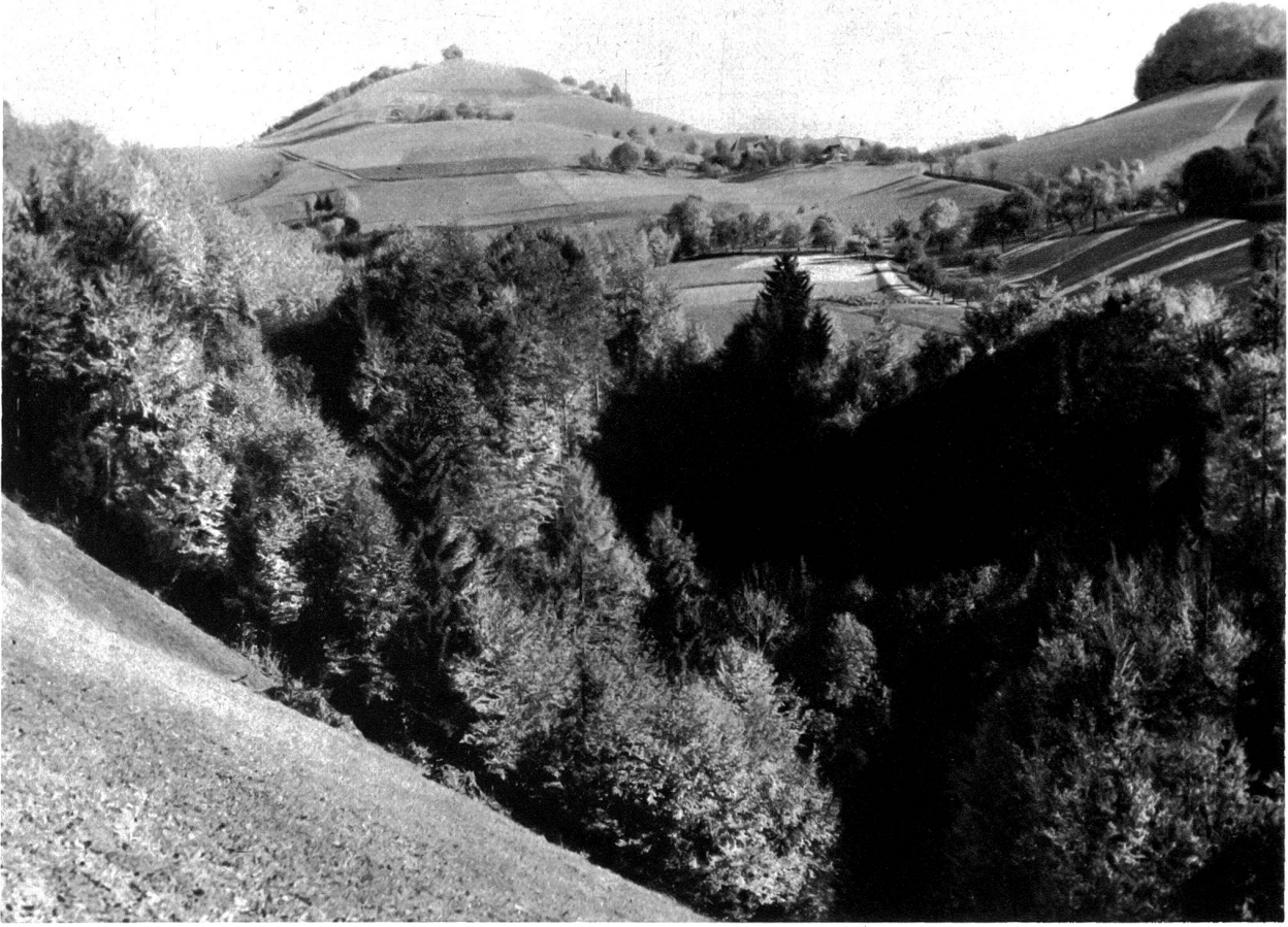
Blick von der Ruine Grimmenstein auf den Oberbühlknobel