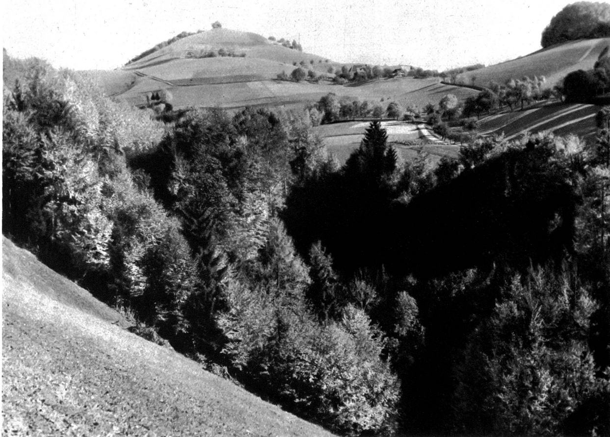
Blick von der Ruine Grimmenstein auf den Oberbühlknobel