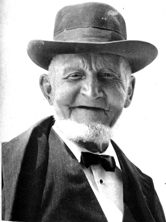
Ueber 80-Jähriger aus der Gegend von Wynigen

„Mein lang ersehntes Wanderziel, Das ist der runde Oberbühl Mit seiner stolzen Linde. Sie ruft ins ganze Land hinaus: Des Landmanns Glück ist hier zu Haus, Bei Meister und Gesinde. Die Aussicht stört an dieser Stell' Kein Bellevue und kein Grand Hotel Mit töricht eitlem Brunke...“