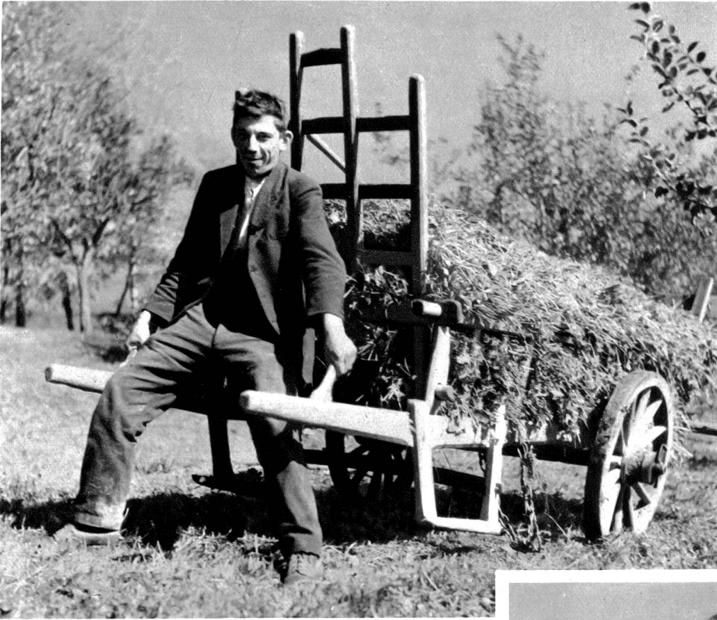
Mit den Grasschnecken muss an den meisten Orten der Wynigenbergen das Futter eingeholt werden.

marschieren durch ein kleines walddunkles Tälchen nach Kappelen, wo seit über 200 Jahren ein kleines Heilbad Rheumatikern Heilung zu bringen sucht. Wer nicht mehr der hier weitausholenden Straße folgen will, zweigt wenig oberhalb des Bades links ab und steigt durch schönen Wald und durch Wiesen zum kleinen Dertchen Friesenberg. Da ist wieder so eine stattliche, runde Kuppe, ein schöner Aussichtspunkt. Früher trönte ihn die stolze Burg der Edlen von Friesenberg, einem Geschlecht, das auch in Rüderswil und Regenstorf Besitzungen hatte. Es erlosch im 14. Jahrhundert. Die Burg gehörte 1382 dem Petermann von Mattstetten, einem Vasallen der Grafen von Kyburg. Sie wurde im Burgdorfer Krieg von 1383 so gründlich zerstört, daß heute keine Mauern mehr sichtbar sind. Nur der mächtige Burggraben hat sich erhalten.