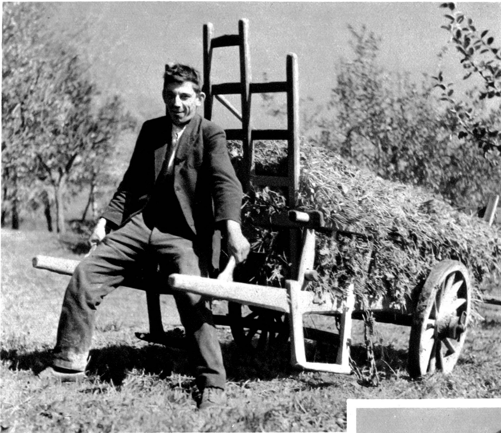
Mit den Grasschnecken muss an den meisten Orten der Wynigenbergen das Futter eingeholt werden.

marschieren durch ein kleines walddunkles Tälchen nach Kappelen, wo seit über 200 Jahren ein kleines Heilbad Rheumatikern Heilung zu bringen sucht. Wer nicht mehr der hier weitausholenden Straße folgen will, zweigt wenig oberhalb des Bades links ab und steigt durch schönen Wald und durch Wiesen zum kleinen Dertchen Friesenberg. Da ist wieder so eine stattliche, runde Kuppe, ein schöner Aussichtspunkt. Früher trönte ihn die stolze Burg der Edlen von Friesenberg, einem Geschlecht, das auch in Rüderswil und Regenstorf Besitzungen hatte. Es erlosch im 14. Jahrhundert. Die Burg gehörte 1382 dem Petermann von Mattstetten, einem Vasallen der Grafen von Kyburg. Sie wurde im Burgdorfer Krieg von 1383 so gründlich zerstört, daß heute keine Mauern mehr sichtbar sind. Nur der mächtige Burggraben hat sich erhalten.