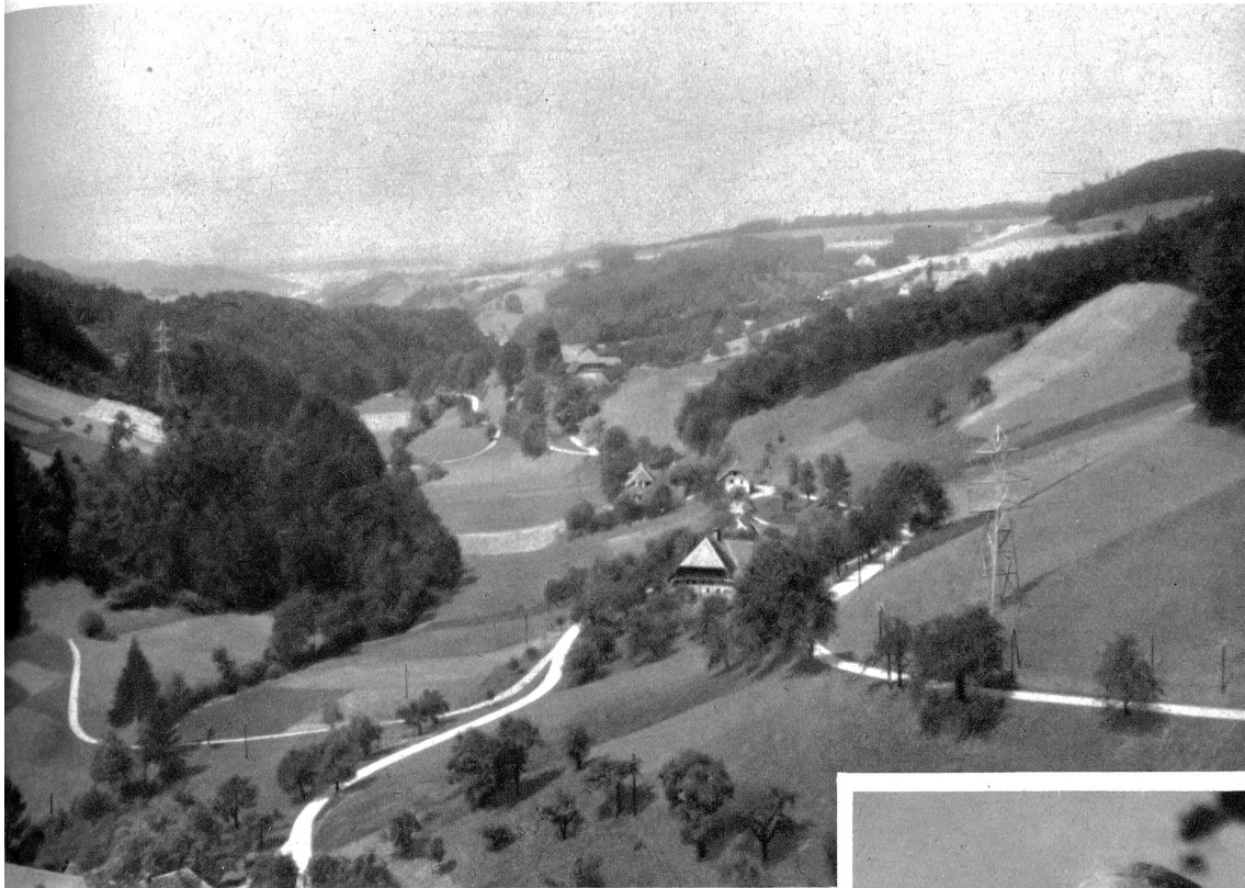
Blick auf den ganzen Kappelengraben gegen Wynigen. Rechts hinten an der Strasse das Bad

„Mein lang ersehntes Wanderziel, Das ist der runde Oberbühl Mit seiner stolzen Linde. Sie ruft ins ganze Land hinaus: Des Landmanns Glück ist hier zu Haus, Bei Meister und Gesinde. Die Aussicht stört an dieser Stell' Kein Bellevue und kein Grand Hotel Mit töricht eitlem Brunke...“