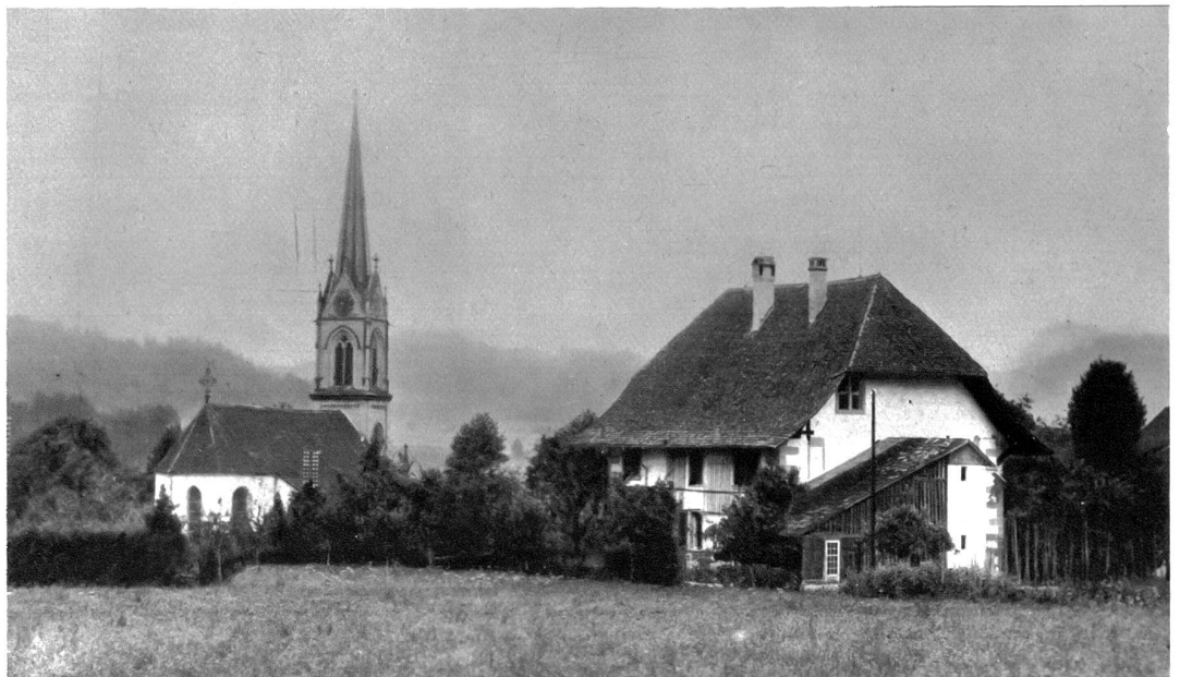
Kirche und Pfarrhaus in Lützelflüh

Auf dem Friedhof ruhen die Zeitgenossen des Dichters, die ihm zu seinen Büchern Modell standen, denen er den Spiegel