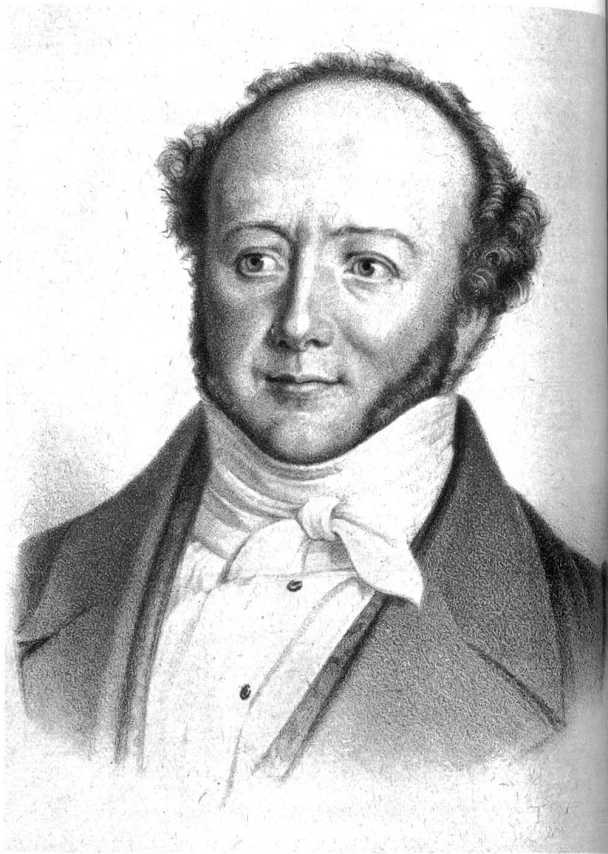
Jeremias Gotthelf. Nach einer alten Lithographie

vorhielt und die Schwächen zeigte, daß sie ihrem Pfarrherrn recht gram wurden. Da sind aber auch die senkrechten, aufrechten, wackeren Breni und Rätli, die in ihrer Gesinnung wahrhaft edlen Bäuerinnen. Wir suchen Gotthelfs Grabstätte. Der Dichter ruht südlich der Kirche. Einfach, schlicht ist die Ruhestätte des großen Geistes, der graue Stein von Epheu umrankt, von den Zweigen einer Trauerweide überschattet. Wir lesen die Inschrift: „Hier ruht im Frieden Gottes Albert Vigius, Jeremias Gotthelf, von Bern, während 22 Jahren Pfarrer dieser Gemeinde,