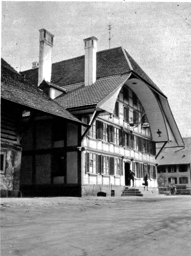
Gasthof zum Ochsen in Lützelflüh, wo Jeremias Gotthelf seine Studien machte

Natürlich gehen wir auch hinüber ins Pfarrhaus, 1665 gebaut. Es hat seit Gotthelfs Zeiten sein Aussehen wenig verändert, ist so recht ein Bild pfarrherrlicher Behäbigkeit. Mitten in einer großen Hoffstatt liegt es, unter deren Bäumen Gotthelf