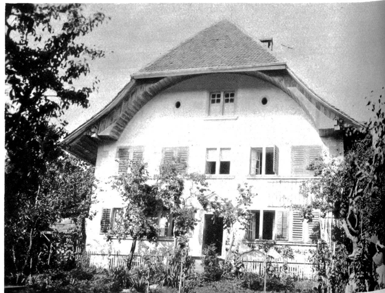
Pfarrhaus in Lützelflüh