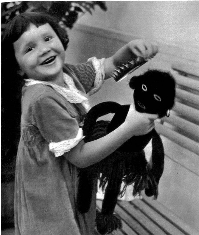
Auch eine Krönung