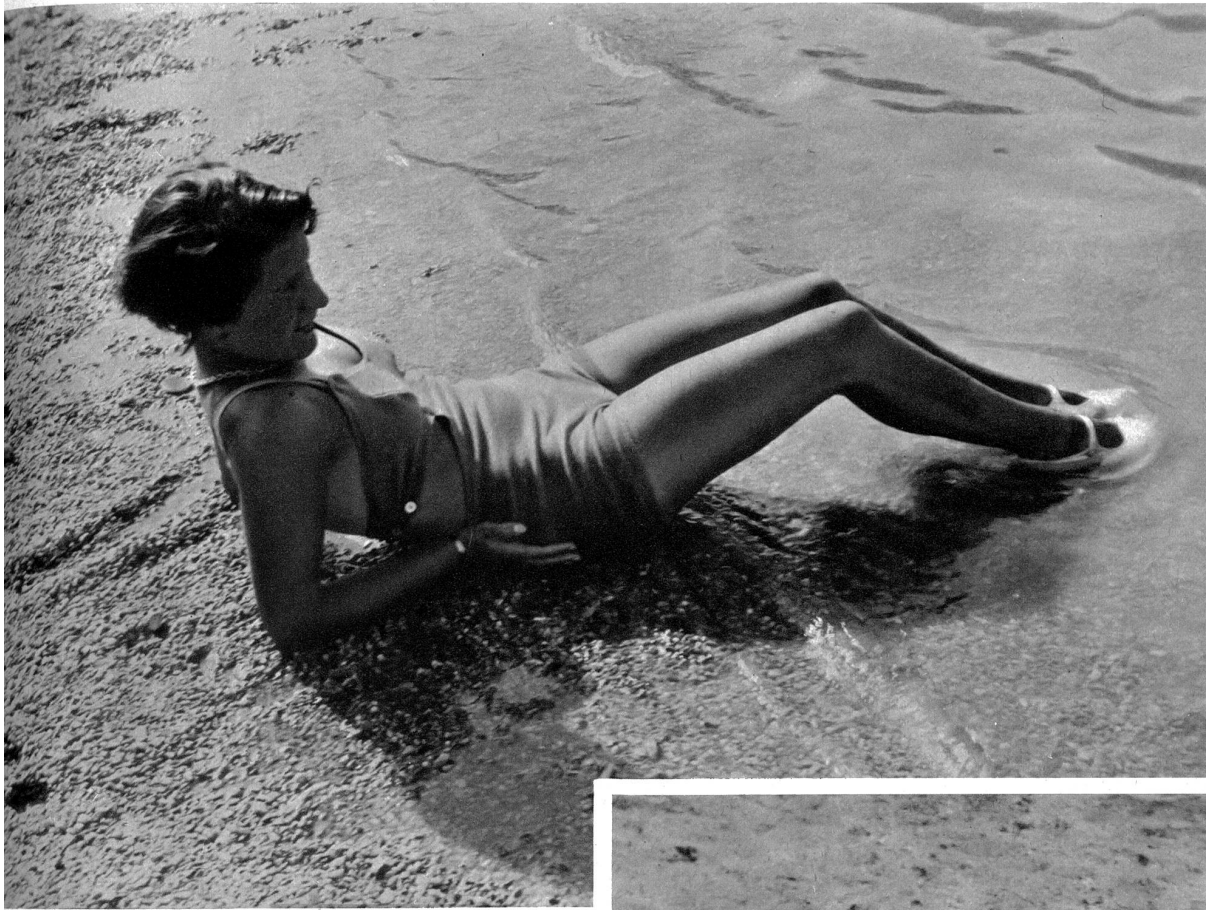
Ist das Wasser wohl warm genug?