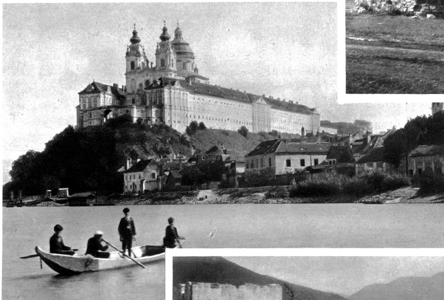
Das berühmte Babenbergertstift Melk

Spitz a. d. Donau. Im Vordergrund die Ruine Hinterhaus, einstige Trutzburg des Ritter von Kuenring. Ihr Bau, ganz aus Bruchsteinen naher Gneis- und Syenitlager aufgeführt, bezeugt noch heute die kühne Bauart ritterlicher Zeit. Ueber den wohl erhaltenen zackigen Ringmauern mit starken Rundtürmen an den Ecken erhebt sich ungebroschen ein mächtiger quadratischer Bergfried, der entzückenden Ausblick gewährt